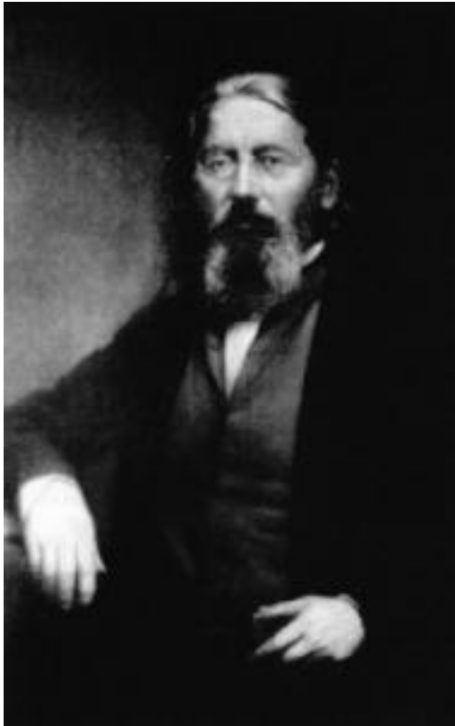
► Abb. 2.8 Constantin Hering.

Bei Alumina werden die 3 Symptome aus den CK „Arger Schwindel beim Gehen und Sitzen, als sollte er über den Haufen fallen, oft mehre Tage, mit Strammen im Genick nach dem Kopfe zu.“ (Nr. 61), „Schwanken beim Gehen, wie in Trunkenheit.“ (Nr. 67) und